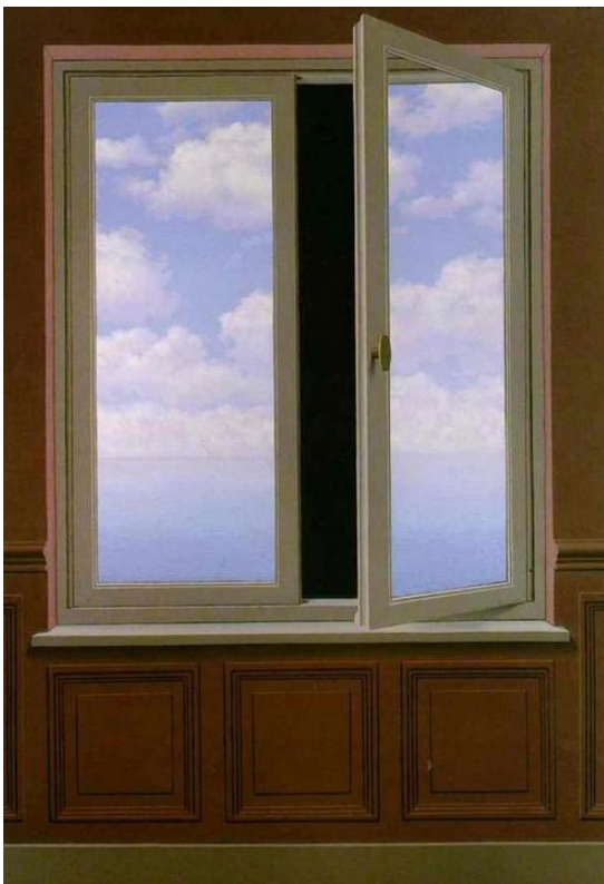
René Magritte , La lunette d'approche - de telescoop 1963.