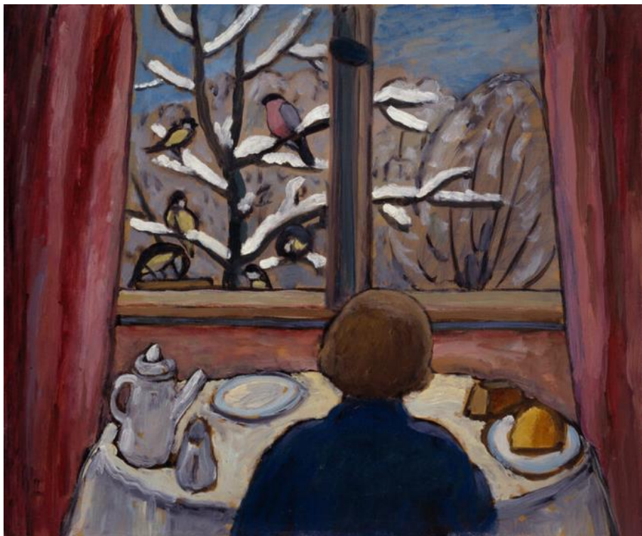
Gabriele Münter : Ontbijt van de vogels 1934.