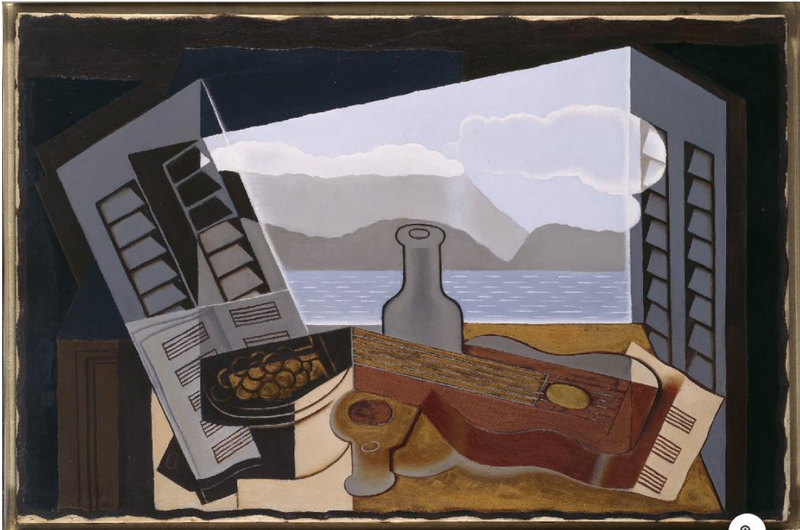
Dit voorbeeld is van Juan Gris: The open window 1921. (Voorbeeld uit het kubisme; Kenmerkend meerdere standpunten – men “speelde” met het perspectief). Toch zien we aan de luiken dat het hier om een zicht door het raam gaat.