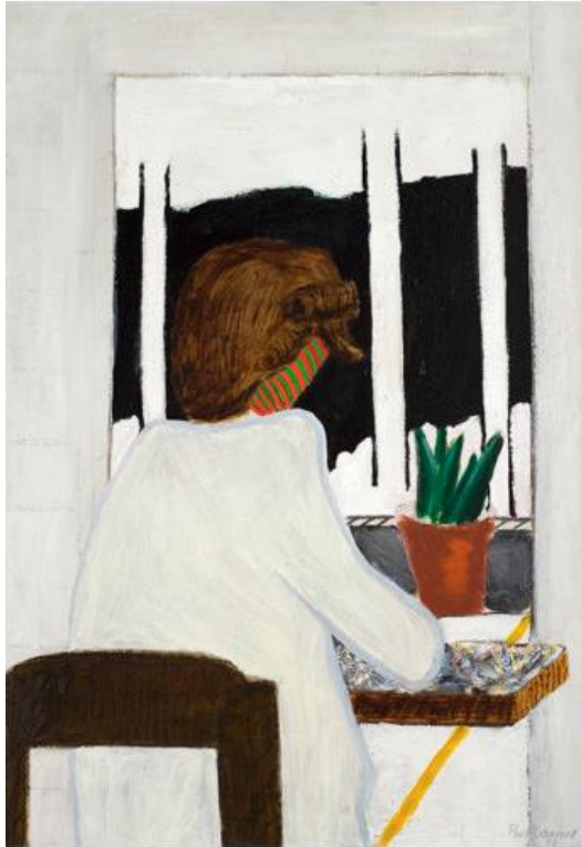
Werk van Roger Raveel : Vrouw voor het venster 1952.