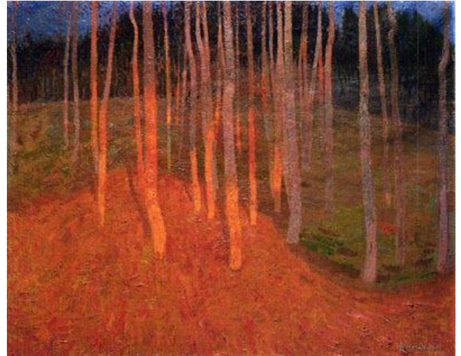
Leon de Smet

Je mag een foto nemen van je werkje en sturen naar foto@sabkzottegem.be